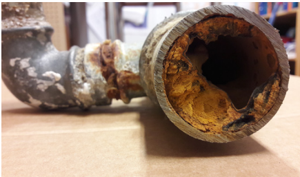
Yli 50 vuotta vanhat vesijohdot voivat kasvaa lähes umpeen ja heikentää veden laatua.

Kiinteistön ja vesihuoltolaitoksen vastuuraaja on vesijohtoverkon osalta runkovesijohdossa. Jätevesi- ja hulevesiverkoston osalta vastuuraaja on runkoviemärisissä tai liitoskaivossa. Myös kellaritilojen padotusventtiili tai pumppaamo on kiinteistön vastuulla. Jos padotuskorkeuden alapuolisiin tiloihin tulvii viemäriveresiä, tulvasta aiheutuneet vahingot ovat kiinteistön omalla vastuulla.