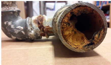
Yli 50 vuotta vanhat vesijohdot voivat kasvaa lähes umpeen ja heikentää veden laatua.

Kiinteistön ja vesihuoltolaitoksen vastuuraaja on vesijohtoverkon osalta runkovesijohdossa. Jätevesi- ja hulevesiverkoston osalta vastuuraaja on runkoviemäri- tai liitoskaivossa. Myös kellaritilojen padotusventtiili tai pumppaamo on kiinteistön vastuulla. Jos padotuskorkeuden alapuolisiin tiloihin tulvii viemäriä, tulvasta aiheutuneet vahingot ovat kiinteistön omalla vastuulla.