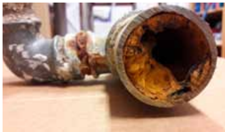
Över 50 år gamla vattenledningar kan nästan växa igen och försvaga vattnets kvalitet.

Ansvarsgränsen mellan fastigheten och vattentjänstverket är stamvattenledningen vad gäller vattenledningsnätet. I fråga om spill- och dagvatten-nätet är gränsen huvudavloppet eller anslutningsbrunnen. Fastigheten ansvarar också för en eventuell uppdrämningsventil i källaren eller ett pumpverk. Om det svämmar över avloppsvatten nedanför uppdrämningshöjden, svarar fastigheten själv för skadorna.